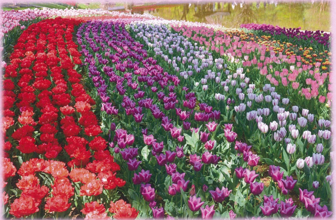
【立川昭和記念公園 チューリップ】